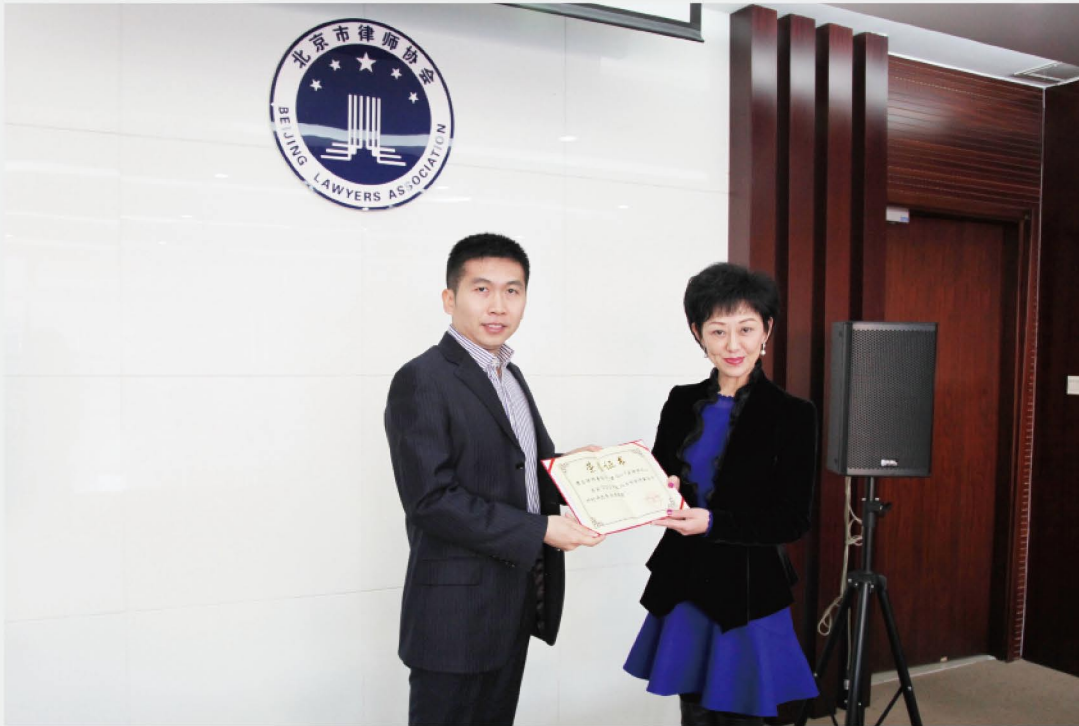
《君合》（法律评论）荣获“2013年度北京市律师事务所所刊评选专业类银奖”