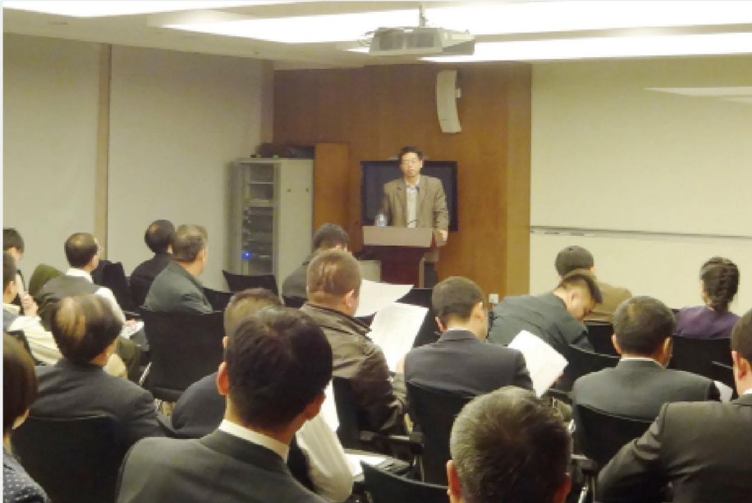
君合律师事务所与欧文沙龙合作举办由发改委国土开发与地区经济研究所高国力副所长主讲的“土地改革的现状与前景”研讨会